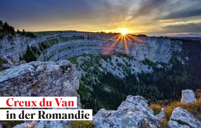
Creux du Van in der Romandie