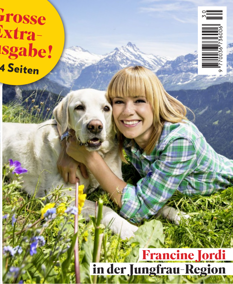
Francine Jordi in der Jungfrau-Region